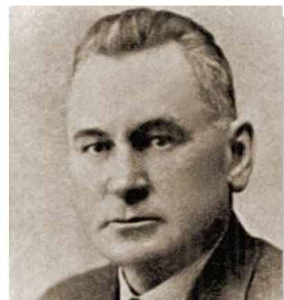
С. П. Тимошенко